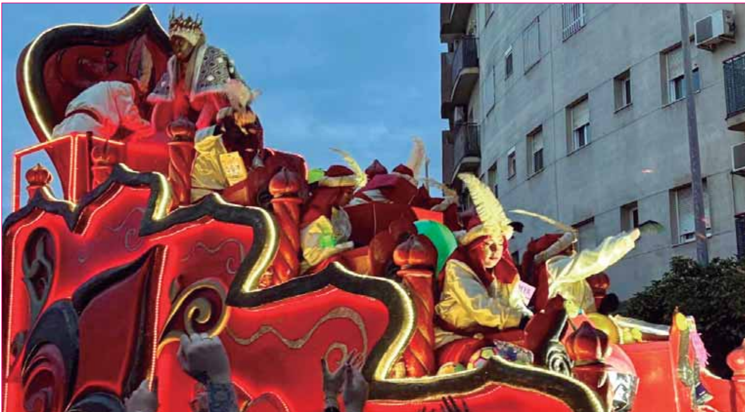
Montequinto vivió un día ilusión y de magia con la Cabalgata, que tuvo que adelantar un día su salida por la lluvia

calzadas más anchas, con arcenes exteriores e interiores optimizados. El proyecto responde al intenso tráfico que soporta la autovía, llegando a 74.000 vehículos.