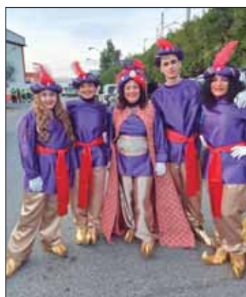
Los vecinos de Montequinto disfrutaron de su Heraldo y su cabalgata, a pesar de la lluvia que amenazó a esta última. Un perfecto final para concluir las vacaciones navideñas.

Con algo más de incertidumbre se vivieron las horas previas de la cabalgata de este año. Y es que, la salida, se modificó hasta en dos ocasiones, ya que al principio se adelantó el horario para pasarlo a la mañana del día cinco, debido a las malas previsiones que se daban para la tarde del día 5. Sin embargo, se tuvo que volver a modificar y adelantarlo a la tarde del día 4, ya que los pronósticos empeoraron para la jornada de mañana.