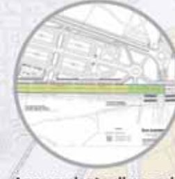
Aparcamiento disuasorio Avenida de la Libertad

Obras financiadas por la Unión Europea. Recuperación, Transformación y Regeneración (Ministerio de Transportes y Movilidad Sostenible) cofinanciado por el Ayuntamiento de