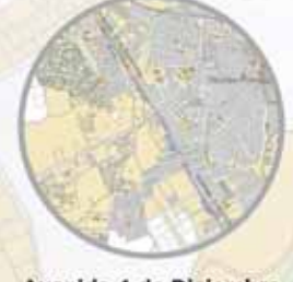
Avenida 4 de Diciembre Antigua N IV