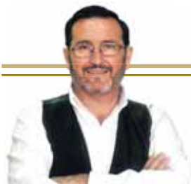
EDUCADEMIA MONTEQUINTO Avda. Madre Paula Montalt, 65 Tel.: 634.873.779 • Whatsapp: 660.124.865