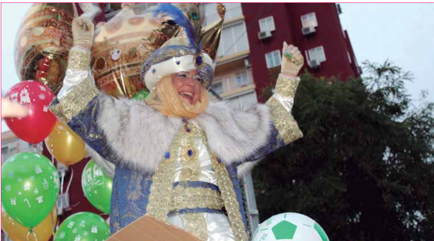
El barrio despedirá el año con atractivas ofertas para seguir disfrutando las fiestas, mientras espera a la Cabalgata

como la ausencia de profesionales de medicina de familia, por lo que «no hay plantilla suficiente para prestar atención sanitaria a su población de referencia».