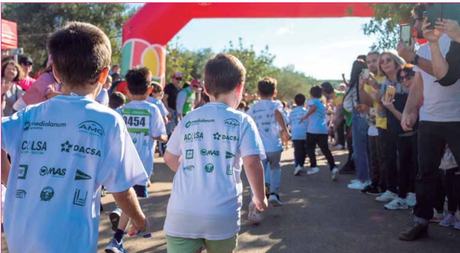
Crecer con Futuro celebra su carrera solidaria el próximo día 17 de noviembre en la Dehesa de Doña María.

seguir haciendo llegar más productos. El Ayuntamiento de Dos Hermanas ha habilitado el Edificio Bécquer como punto de entrega de productos solidarios.