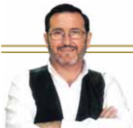
EDUCADEMIA MONTEQUINTO Avda. Madre Paula Montalt, 65 Tel.: 634.873.779 • WhatsApp: 660.124.865