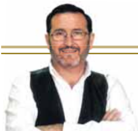
EDUCADEMIA MONTEQUINTO Avda. Madre Paula Montalt, 65 Tel.: 634.873.779 • WhatsApp: 660.124.865