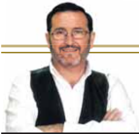
EDUCADEMIA MONTEQUINTO Avda. Madre Paula Montalt, 65 Tel.: 634.873.779 • WhatsApp: 660.124.865