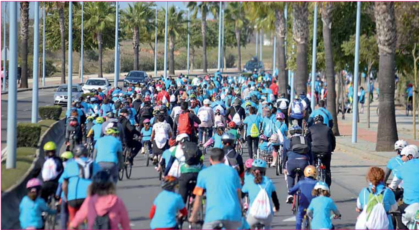
El 'Día de la Rueda' se celebrará en Montequinto el próximo domingo, 8 de octubre.

bibliotecas y fomentar la venta de libros y artesanías entre otras. La Biblioteca contribuye así a crear un espacio de encuentro entre librerías, escritores y lectores.