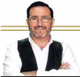
EDUCADEMIA MONTEQUINTO Avda. Madre Paula Montali, 65 Tel.: 634.873.779 • WhatsApp: 660.124.865