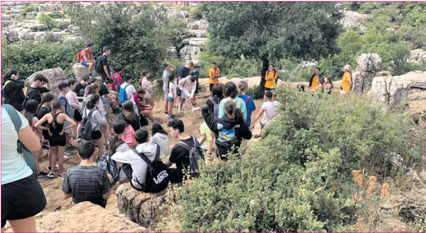
Ya se conocen las fechas para el sorteo de los campamentos del Programa 'Verano Joven'.

Consistorio hacerse cargo del coste del servicio. De esta forma, los autobuses urbanos seguirán siendo gratuitos hasta final de año para todos los nazarenos.