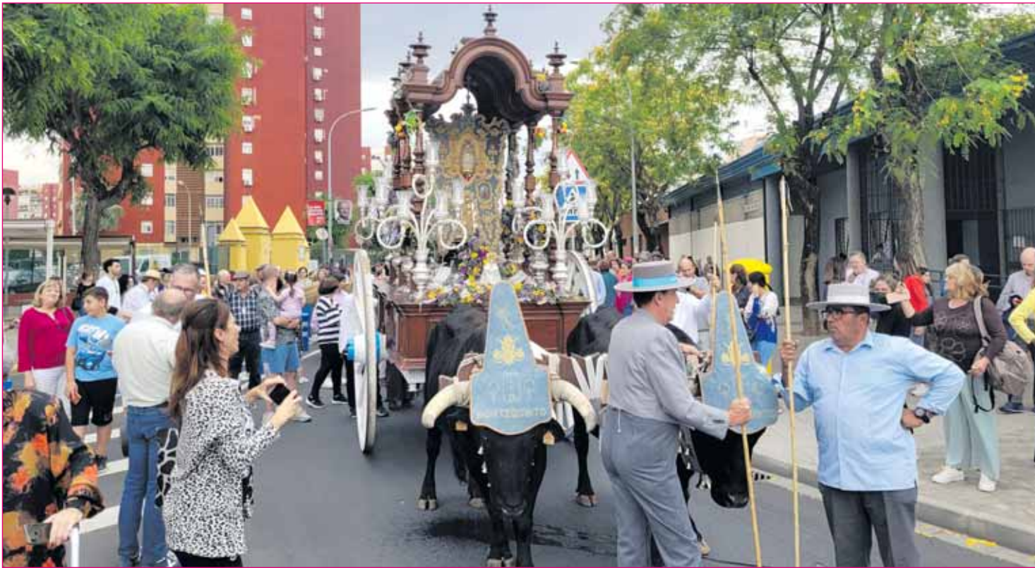
La Hermandad del Rocío de Montequinto partió el pasado lunes hacia la aldea de El Rocío

Hermanas han sido convocados a esta cita un total de 107.781 electores y el número de personas que votan por primera vez (18 años) es de 1.689 jóvenes.