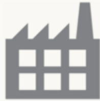
I.A.E. IMPUESTO DE ACTIVIDADES ECONÓMICAS