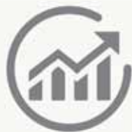
PLUSVALÍA MUNICIPAL IMPUESTO SOBRE EL INCREMENTO DE VALOR DE LOS TERRENOS DE NATURALEZA URBANA