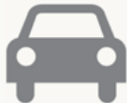
I.V.T.M. IMPUESTO DE VEHÍCULOS DE TRACCIÓN MECANICA