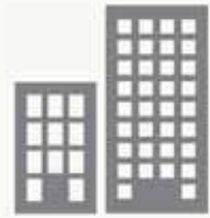
I.B.I. IMPUESTO DE BIENES INMUEBLES