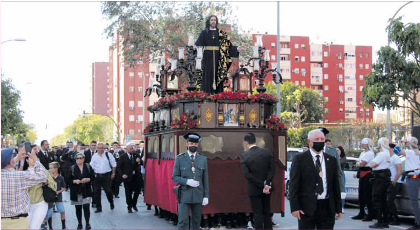
Montequinto vivirá su primera Semana Santa con nazarenos en la calle.

Durante el día habrá actuaciones musicales, espectáculos y actividades para niños. El evento festivo durará hasta, aproximadamente, las 18.00 horas de la tarde.