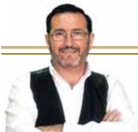
EDUCADEMIA MONTEQUINTO Avda. Madre Paula Montali, 65 Tel.: 634.873.779 • WhatsApp: 660.124.865